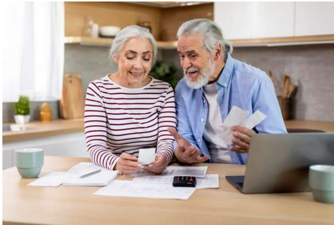
Plan-(Fix-)Kosten zum Pensionsantritt

Plan-(Fix-)Kosten zum Pensionsantritt und zusätzliche Aufwendungen, die sich im Alter ergeben können (Wohnungsumbau, Pflege und Betreuung, etc.)