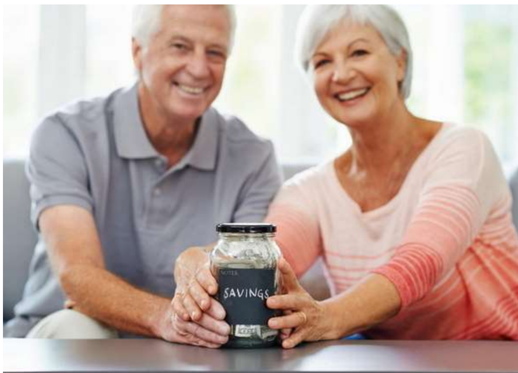
Kapital-Bedarfs-Check zum Pensionsantritt

www.vorsorgeplan.at/wb-pensions-vorsorge/kapital-bedarfs-check